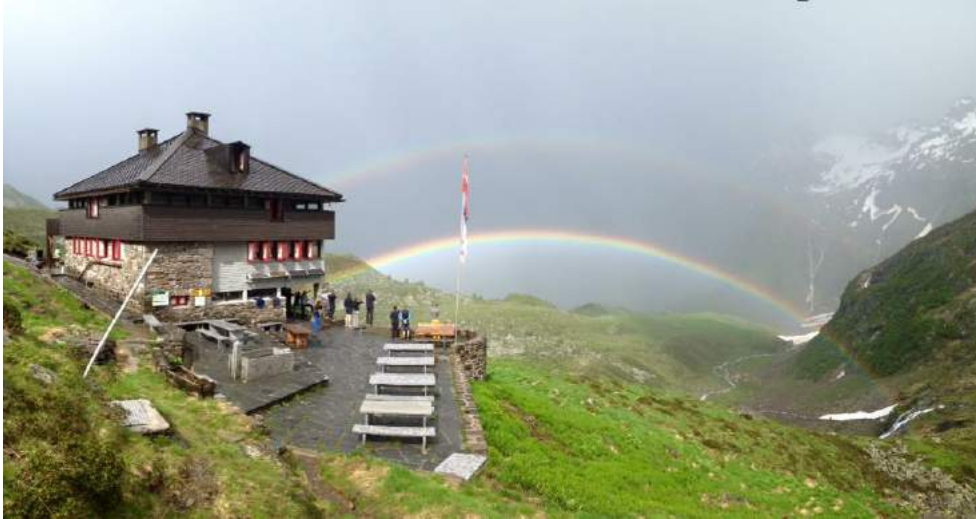
Capanna del Campo Tencia