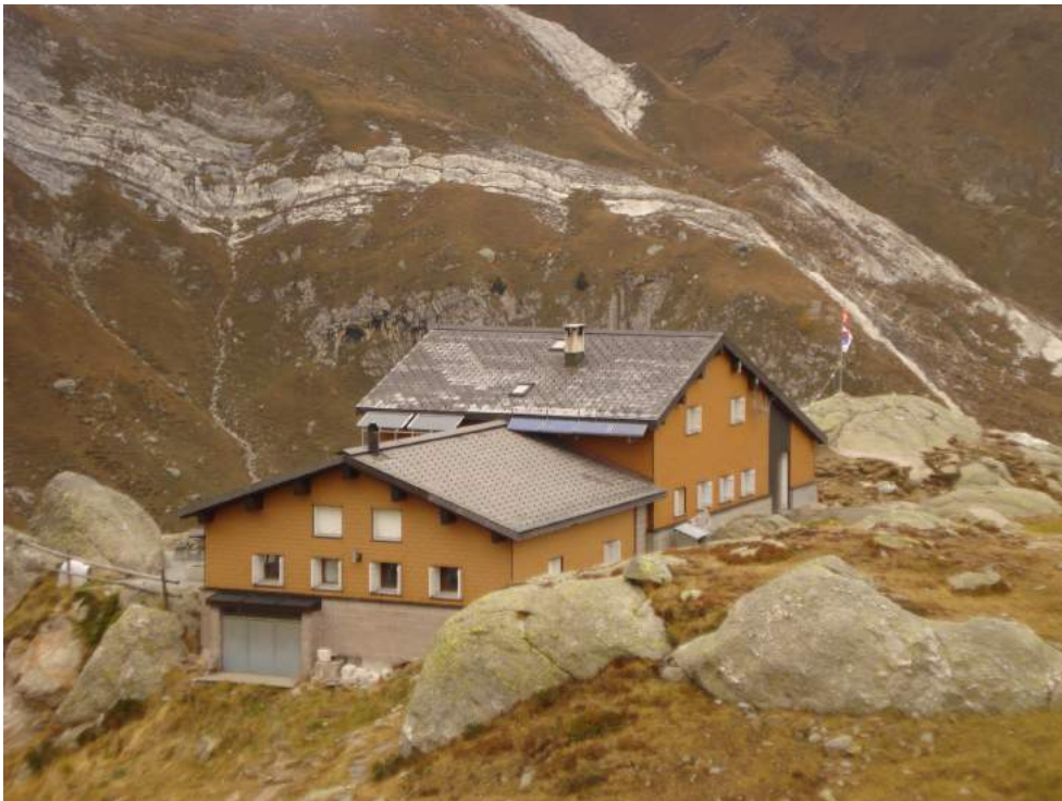
Capanna del Leit